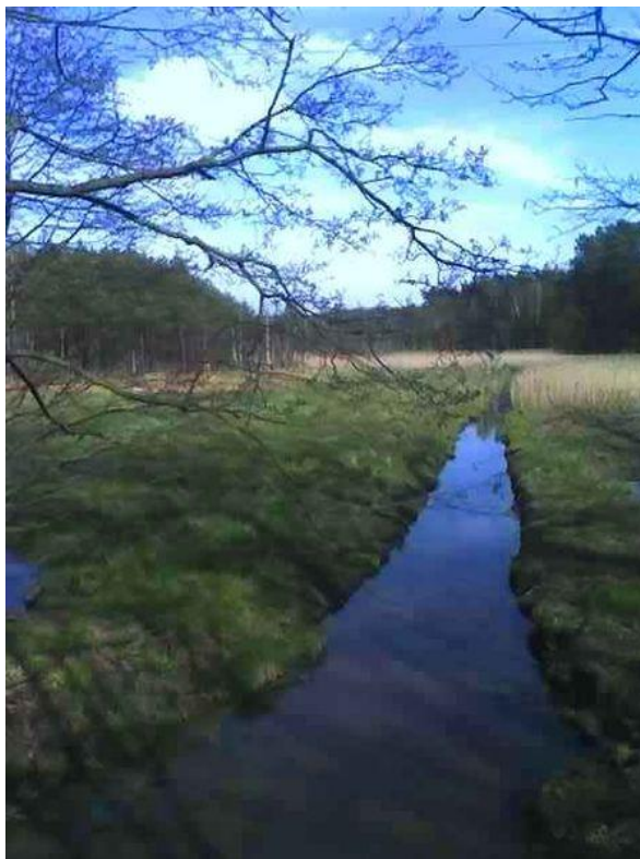
Zdjęcie: Rezerwat Dębów Boruszowickich