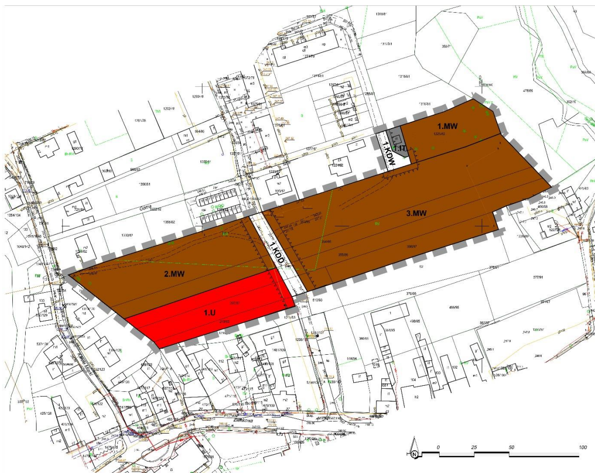
Rys.3 Rysunek projektu planu (pomniejszenie bezskalowe):

Obecnie na obszarze opracowania obowiązuje miejscowy plan zagospodarowania przestrzennego Gminy Tworóg w sołectwie Brynek i Tworóg, przyjęty uchwałą nr XLIX/525/2010 Rady Gminy Tworóg z dnia 25 stycznia 2010 r. Duża część ustaleń z obowiązującego planu, w szczególności w zakresie przeznaczeń podstawowych została w projekcie planu utrzymana.